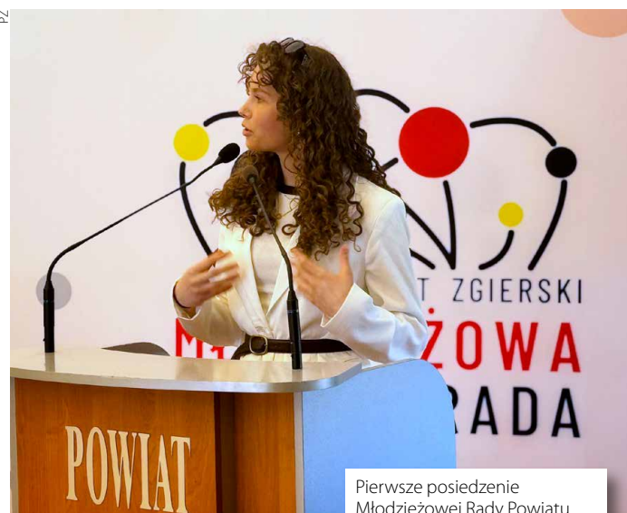
Pierwsze posiedzenie Młodzieżowej Rady Powiatu Zgierskiego pokazało, że mimo różnicy zdań, młodzi potrafią się porozumieć

Choć była to pierwsza sesja, jej przebieg pokazał, że młodzi radni nie ograniczają się do symbolicznej roli. Już na starcie musieli zmierzyć się z różnicą zdań i koniecznością osiągnięcia porozumienia. To dopiero początek. Kolejne posiedzenia pokażą, jaką rolę młodzieżowa rada odegra w życiu powiatu. ●