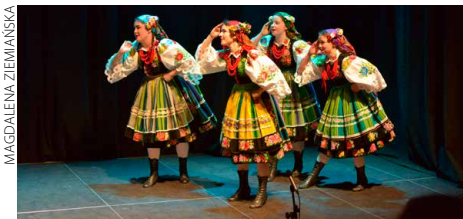
ZPiT Boruta zachwyca choreografią i strojami

Tradycyjnie w maju Zespół Pieśni i Tańca „Boruta” zaprasza Zgierzan na swój wiosenny występ. Koncert odbędzie się w Starym Młynie w środę 27 maja o godzinie 16.30. Fani zespołu z pewnością zauważą w programie wiele nowości: odświeżony repertuar taneczny przeplatany piosenkami. Na scenie pokażą się wszystkie grupy wiekowe, co dla publiczności oznacza, że będzie niezła, energetyczna mieszanka stylów wykonawczych. Bilety do nabycia w kasie MOK i na stronie www.starymlynzgierz.pl (mz)