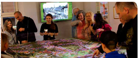
Organizatorzy mają nadzieję, że tegoroczny program Nocy Muzeów jak zwykle przyciągnie wielu zwiedzających