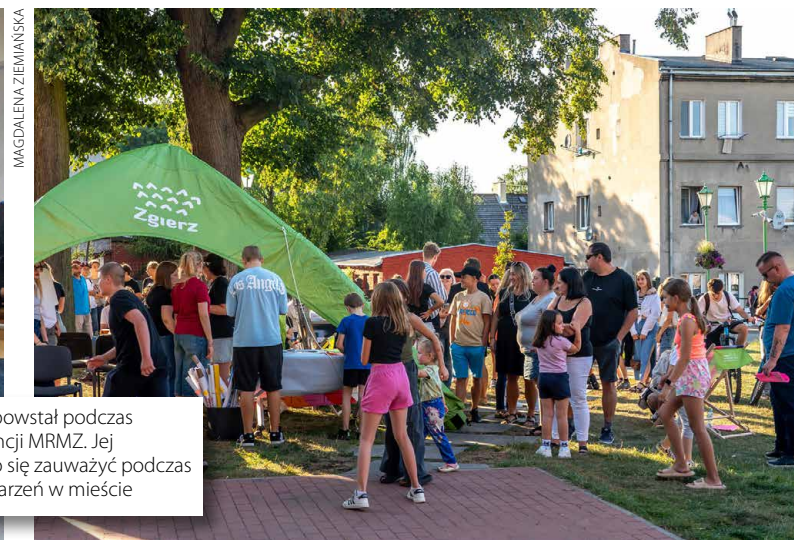
Pomysł „Strefy M” powstał podczas poprzedniej kadencji MRMZ. Jej aktywność dawało się zauważyć podczas plenerowych wydarzeń w mieście