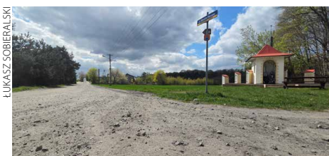
Ul. Obrońców Warszawy idzie do przebudowy

Inwestycja jest odpowiedzią na zgłaszane przez mieszkańców potrzeby poprawy jakości lokalnej infrastruktury drogowej. (rk)