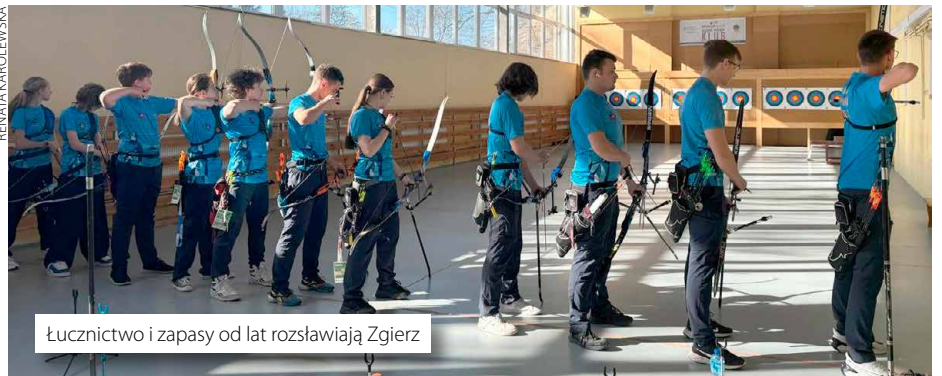
Łuczniczka i zapaśnicy od lat rozstawiają Zgierz

Zgierskie kluby dofinansowanie będą też mogły przeznaczyć na opłacanie trenerów, zakup suplementów diety, diagnostykę i infrastrukturę. Zarówno UKS „Piątka”, jak i ZTA Zgierz miały w swoich składach uczestników igrzysk olimpijskich, oby wsparcie pozwoliło na podtrzymywanie tych tradycji. (jn)