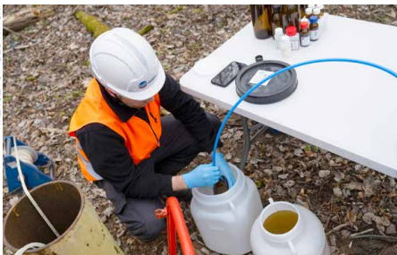
Trwają prace, które mają na celu uporządkowanie terenów po dawnych państwowych zakładach Boruta

ska. Zadanie to finansowane jest z Krajowego Planu Odbudowy.