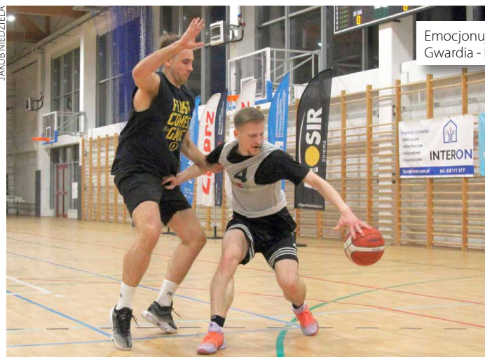
Emocjonujący finał Stara Gwardia - Bad Boys