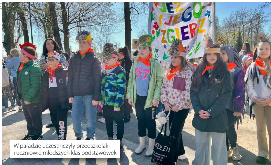
W paradzie uczestniczyły przedszkolaki i uczniowie młodszych klas podstawówek

Już po raz siódmy zorganizowano w naszym mieście wielką paradę „Budzimy Jeża ze Zgierza”. Wyróżniała ją rekordowa liczba uczestników (około 500 osób!), udział dzieci z placówek niepublicznych oraz tematyka konkursu. Tym razem młodzi Zgierzanie tworzyli prace plastyczne na temat miejśc, w których lubią spędzać czas. Najczęściej wskazywano Malinkę, sportowe obiekty MOSiR, Stary Młyn oraz placówki oświatowe. Tradycyjnie pochód przeszedł z Placu Jana Pawła II do pasażu Parku Miejskiego im. Kościuszki. Na mecie na uczestników czekały występy artystyczne pod okiem Julii Szwejcer i rozstrzygnięcie konkursu na najciekawszego jeża. Laureatem głównej nagrody zostało przedszkole „Mały Domek”. Organizatorem parady jest Szkoła Podstawowa Nr 1 z Oddziałami Integracyjnymi w Zgierzu. (jn)