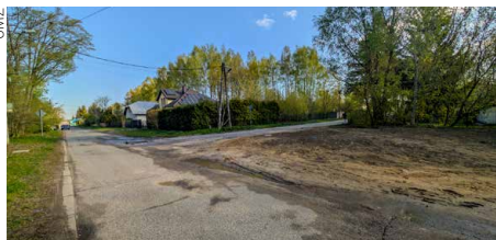
To skrzyżowanie wkrótce zmieni wygląd. Miasto pozyskało środki na przebudowę ulic Żeromskiego i Pułaskiego

To kolejna inwestycja drogowa, która ma poprawić infrastrukturę komunikacyjną w Zgierzu i komfort codziennego funkcjonowania mieszkańców. (rk)