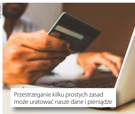
Przestrzeganie kilku prostych zasad może uratować nasze dane i pieniądze

Transakcje online są nieodłącznym elementem życia – bez problemu możemy w zaciszu domowym opłacić rachunki, kupić wycieczkę wakacyjną czy dowolne zakupy. Jednak ta wygoda niesie ze sobą pewne ryzyka: wystarczy dosłownie chwila nieuwagi, by stać się celem cyberprzestępców. Dlatego, chcąc zadbać o swoje pieniądze i dane, sprawdźmy, na czym polegają bezpieczne płatności w Internecie.