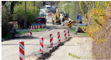
Z nowej nawierzchni ul. Dubois skorzystają m.in. rowerzyści

Trwa modernizacja zgierskich ulic. Na ul. Działkowej (Rudunki) w fazie końcowej są roboty z zakresu przebudowy jezdni oraz stworzenia zjazdów z kostki betonowej, pozostały tam właściwie do wykonania prace wykończeniowe. Przy ul. Rembielińskiego (Rudunki) tworzony jest nowy chodnik. „W ramach tej inwestycji zostanie również wykonana ścieżka rowerowa o nawierzchni z betonu asfaltowego oraz nakładka asfaltowa na jezdni” – informuje Urząd Miasta Zgierza. W bliskim sąsiedztwie, przy ul. Dubois na odcinku między działkami a nasypem kolejowym, wykonywana jest droga z kostki brukowej dla pieszych i rowerzystów. (jn)