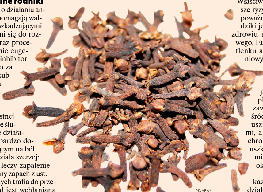
Eugenol zawarty w goździkach ma szereg właściwości prozdrowotnych

Goździki (zazwyczaj jeden lub dwa) można rzuć/ssać rano lub po posiłku. W ten sposób odświeżą oddech, uśmierzą ból zęba i zadziałają antyseptycznie na gardło. Można też robić z nich napar, tzw. wodę goździkową: łyżeczkę goździków należy zalać szklanką wrzątku i parzyć pod przykryciem 5-10 minut; pić do trzech razy dziennie po 100 ml. Inną metodą jest moczenie kilku goździków w szklance wody przez całą noc lub gotowanie przez kilka minut (tzw. herbatka goździkowa). Wystarczy nawet wrzucenie dwóch goździków do zaparzonej herbaty lub ziół. Mielone służą jako przyprawa kuchenna lub dodatek do koktajli, owsianki, jogurtu czy kawy.