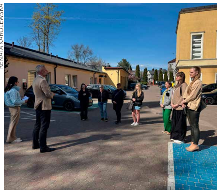
Zwycięzcy zostali zaproszeni po odbiór kompostowników do urzędu miasta

Zadania i pytania nie były szczególnie trudne. I to było zachętą dla uczestników drugiego etapu akcji EKO Challenge, którzy mieli wykazać się wiedzą dotyczącą segregacji